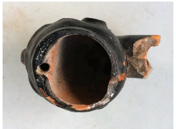
Afb. 6a-b. Zwart beschilderde niet afgewerkte pijp, ongemerkt, geen vormnummer aanwezig. Afgebeeld in de Ziegler catalogus onder vormnummer 1. Bodemvondst Ruhla. Collectie en foto Ron de Haan.