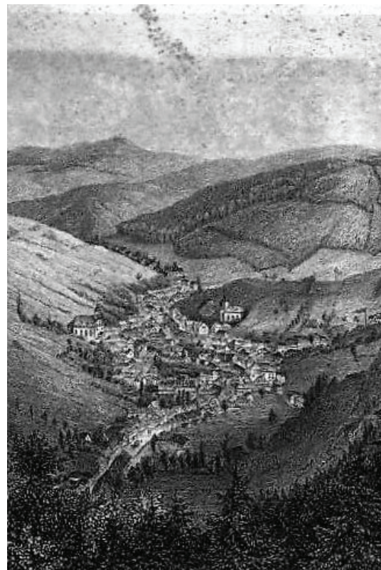
Afb. 2. Prent van Ruhla (detail) in het boek van Ziegler, 1867.