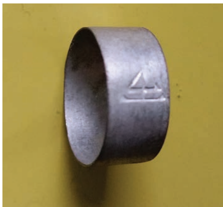
Afb. 4. Ring voor het afmonteren van pijpen met het merk van de firma Ziegler.

ding 4 is een ring te zien met het merk van Ziegler. Deze ringen werden gebruikt voor het afmonteren van pijpen. Ziegler merkte zijn pijpen vaak niet omdat ze onderdelen van derden met hun eigen producten samenvoegden tot een complete pijp. Een dergelijk ring met firmastempel was dan het kenmerk waaraan te zien was dat het om een Ziegler product ging. Vervolgens kwamen de stelen en flexibele slangen en de benen stelen voor de porseleinen pijpen in productie. Al spoedig werden er ook pijpen uit alle soorten materialen, behalve porselein, vervaardigd. Wel werden in Ruhla porseleinenpijpen, die in de wijde omtrek vervaardigd waren, van fraaie afbeeldingen voorzien. Toen later in de 19de eeuw de