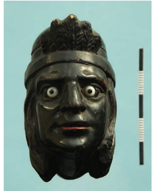
Afb. 7a-b. Pijp met mannenhoofd met verentooi, vormnummer 25. Afgebeeld in de Ziegler catalogus.