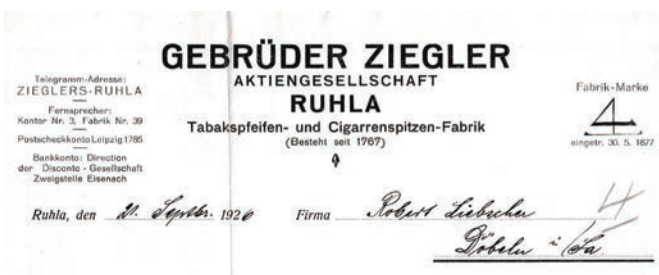
Afb. 1. Briefhoofd Firma Gebrüder Ziegler, 1926.

Er is in eerdere artikelen al uitgebreid ingegaan op de enorme importantie van Ruhla als pijpenmakercentrum. 4 Het hoogtepunt in de ontwikkeling van Ruhla lag ongeveer 100 jaar na de grootste bloeiperiode van Gouda en was ook later dan die van andere Duitse pijppencentra. Dit is verklaarbaar doordat deze centra zich uitsluitend geconcentreerd hebben op de kleipijpenproductie. De producenten in Ruhla hebben daarentegen vanaf de vroegste start alles op het gebied van de productie en samenstelling van rookpijpen naar zich toe getrokken. Het begon in 1737 met het metaalbeslag zoals deksels en blikken inzetbussen voor de houten pijpen. 5 Op afbeelding 1.