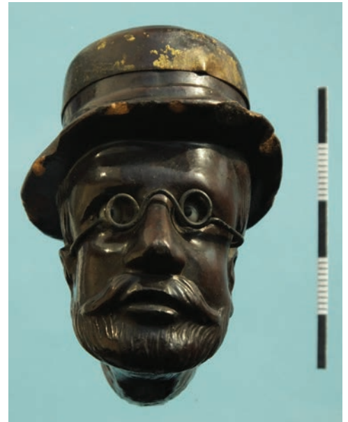
Afb. 8a-b. Pijp met mannenhoofd met hoed en bril, initialen 'GZ' en vormnummer 67. Deze pijp is niet in de hier genoemde Ziegler catalogus afgebeeld.

luchttoevoer komt via de mond binnen en gaat dan via een verticaal kanaaltje tot aan de bovenrand van de ketel. Daar vandaan kan de lucht vrij bij de tabak komen. De tweede pijp is nog spectaculairder: De besnorde en bebaarde man draagt een hoed met een brede ronde rand en is ook weer uitgevoerd met de glazen ogen (afb. 8). Zeer opvallend is het van draad gebogen brilletje dat de pijp een erudiete uitstraling geeft. Het dekselhoedje vormt een geheel met de brede kleirand van de pijp en is verbonden via een kettinkje met de manchet. Deze combinatie vormt de pijp tot een prachtige originele compositie. De pijp is voorzien van de initialen "GZ"