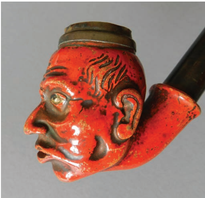
Afb. 5a-c. Pijp met beschilderde ogen, ongemerkt, geen vormnummer aanwezig. Afgebeeld in de Ziegler catalogus onder vormnummer 1. Collectie Ruud Stam, foto Bert van der Lingen.